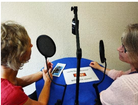
Aufnahmesituation im Podcast-Studio

Am Anfang steht stets ein Kennlerngespräch mit der Person, die interviewt werden soll. Dabei geht es vor allem um die verschiedenen Aspekte „ihres“ Themas und welche davon für den Podcast interessant sein könnten. Zudem werden Aufnahmetechnik und Abläufe besprochen.