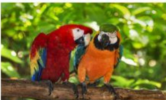
Projektgeschichten: Die Artenvielfalt Brasiliens