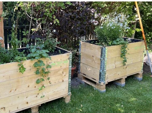
Maßgefertigte Hochbeete können in die Gartengestaltung integriert werden und den Artenreichtum gezielt fördern.

Aufgabe und Ziel von GTG ist es, Menschen und Organisationen für „Mehr Grün in der Stadt“ zu begeistern und durch die Platzierung von Hochbeeten einen Beitrag zur Biodiversität und Lebensqualität im städtischen Raum zu leisten. Interessierte werden von GTG diesbezüglich zur Auswahl passender Hochbeetformate und zur geeigneten Bepflanzung beraten. Aus den akquirierten Kundenaufträgen ergeben sich die Tätigkeiten für die Beschäftigten: Sie produzieren unter fachlicher Anleitung Hochbeete, sind vor Ort am Aufbau und der Bepflanzung beteiligt und übernehmen Pflegearbeiten und Gießensätze.