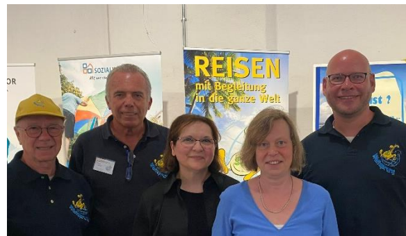
Aktive Unterstützer:innen haben auf der AKTIVOLI für die ehrenamtliche Reisebegleitung geworben.

Teilnahme an der Freiwilligenbörse AKTIVOLI am 26.05.: Hier wurden neue Interessierte für das Ehrenamt der Reise- und Ausflugsbegleitung gewonnen und zu einem Infoabend am 12.06. ins Weitsprung-Büro eingeladen .