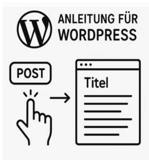
Teammitglieder haben „Schritt für Schritt-Anleitungen“ zum Umgang mit dem Redaktionssystem WordPress entwickelt.

Für die Live-Schaltung des Seelenbrand Magazins ist ein Termin im Sommer 2025 geplant – rechtzeitig von dem nächsten Seelenbrand Festival, das am 5. September stattfinden wird.