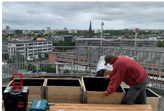
Einsatz über den Dächern der Stadt: Im Auftrag des Hildegarden e. V. wurden Hochbeete auf dem „Grünen Bunker“ platziert.