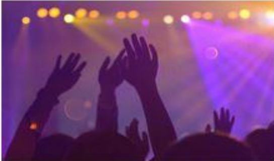
Projektgeschichten: Tomorrowland – Das Lifestyle-Festival

Für die Veröffentlichung der Podcasts wurde bereits eine Domain für die Projektgeschichten reserviert und eine Website gestaltet und vorbereitet.