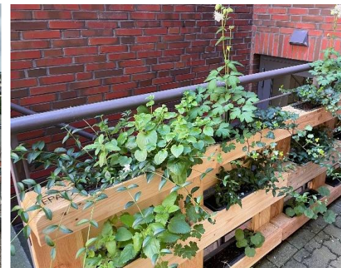
Für jeden Ort gibt es eine geeignete Pflanze! Hier wurde ein schattiger Hotel-parkplatz in der City vertikal begrünt.

Der Aufbau und die Etablierung von GTG wurde im Zeitraum 2018 – 2023 von Aktion Mensch im Rahmen einer „Anschubförderung“ unterstützt. In 2024 musste GTG erstmalig ohne finanzielle Förderung auskommen. Daher ist angestrebt, zunehmend Synergien zwischen GTG und dem ebenfalls von ARINET durchgeführten Gartenprojekt „EssBar – Stadtgarten Rothenburgsort“ zu generieren, z.B. durch Nutzung von Ressourcen, Einkaufsvorteile, Öffentlichkeitsarbeit u.a.