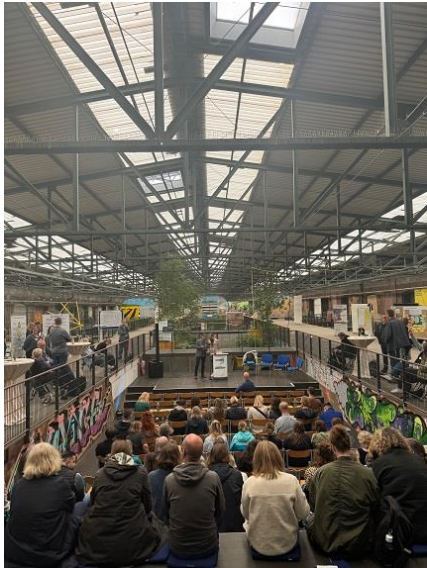
Reporterteams von Radio Strandgut waren beim ARINET Open House im Juni 2024 auf „Stimmenfang“.

"Bunt und unterschiedlich wie Strandgut hat das Leben uns an den Strand von Radio Strandgut getrieben. Mit der nächsten Flut machen wir uns wieder auf zu neuen Ufern". So beschreibt Radio Strandgut seinen Spirit – offen, bewegt, im Fluss.